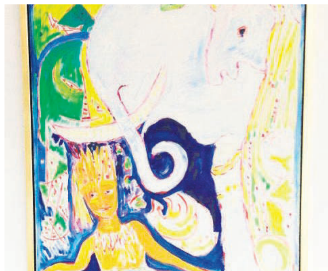
Egill Jacobsens genkendelige streg er blandt dem, der sælges fra lagret i Kunstgalleriet Odense.

Bøger: Forfatterne bag "Kragepigen", "Sorgens ild" og "Pythias anvisninger" er klar med første bog i ny krimiserie. I "Glaslegemer" følger vi kommissær Jens Hurtig efterforske en serie brutale selvmord. Krimien udkommer på Lindhardt og Ringhof 9. marts. (ahy)